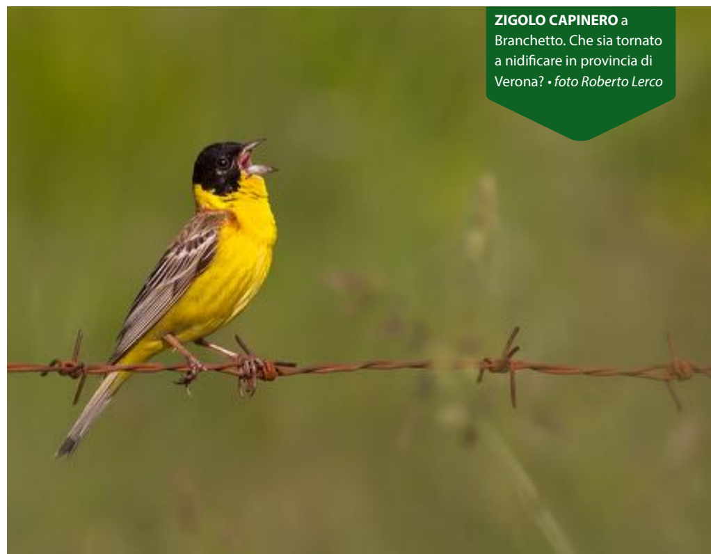
ZIGOLO CAPINERO a Branchetto. Che sia tornato a nidificare in provincia di Verona?

Da giugno in poi a Branchetto una presenza canterina inaspettata, lo ZIGOLO CAPINERO!!!