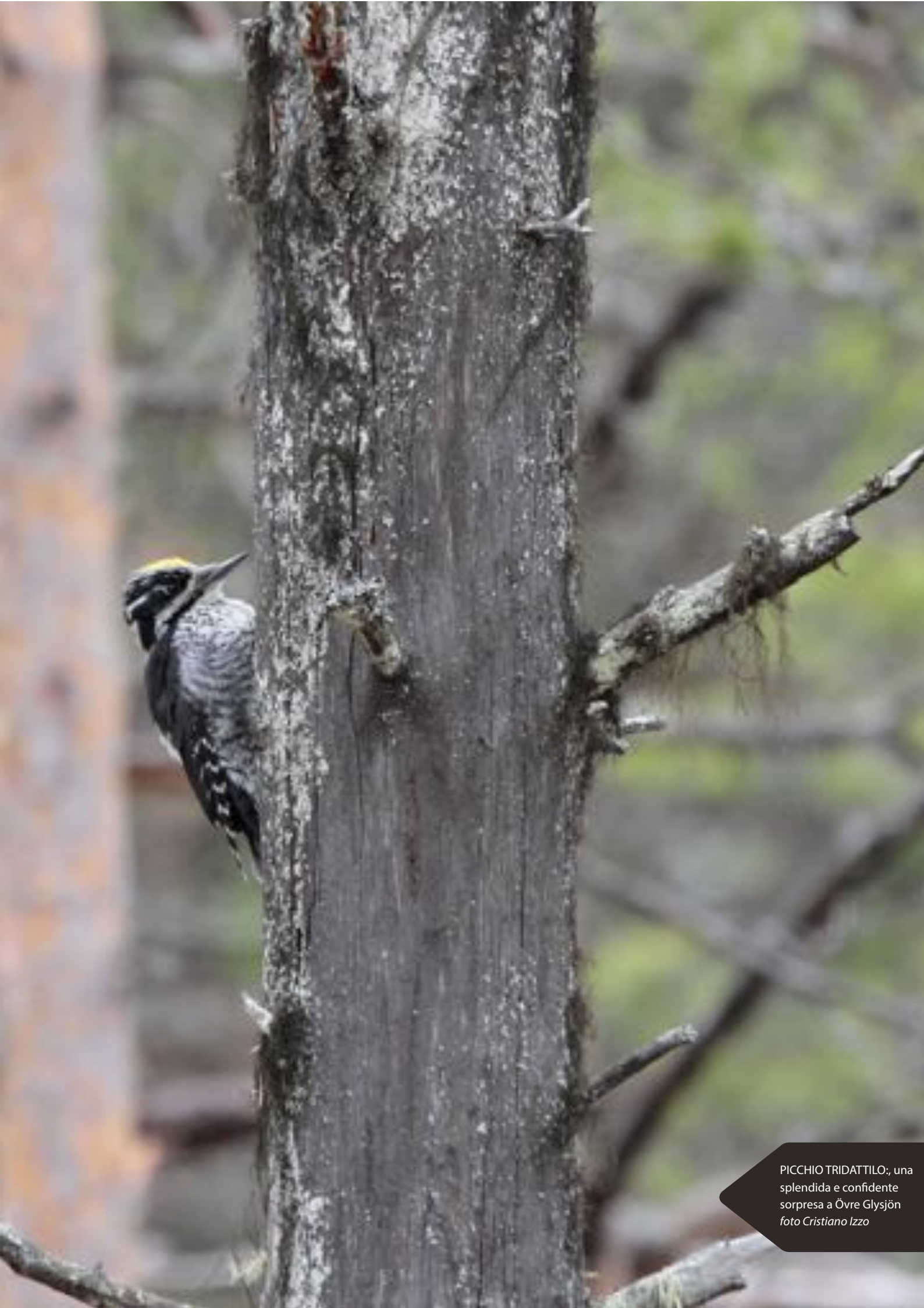
PICCHIO TRIDATTOLO; una splendida e confidente sorpresa a Övre Glysjön