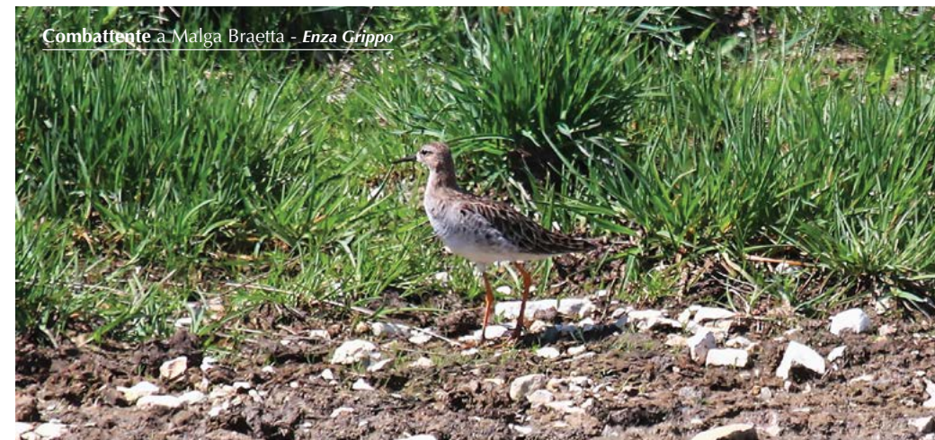
Combattente a Malga Braetta - Enza Grippo

1 ind. nei pressi di Malga Braetta il 10.05 (E. Grippo).