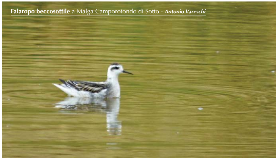
Falaropo beccosottile a Malga Camporotondo di Sotto - Antonio Vareschi