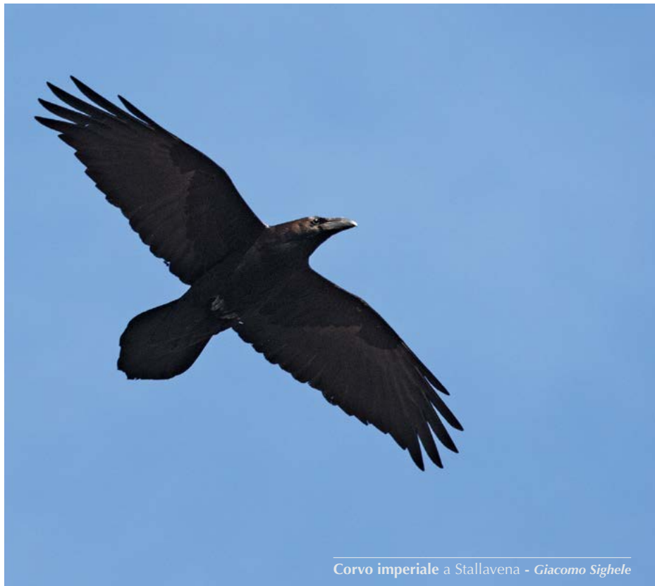
Corvo imperiale a Stallavena - Giacomo Sighele