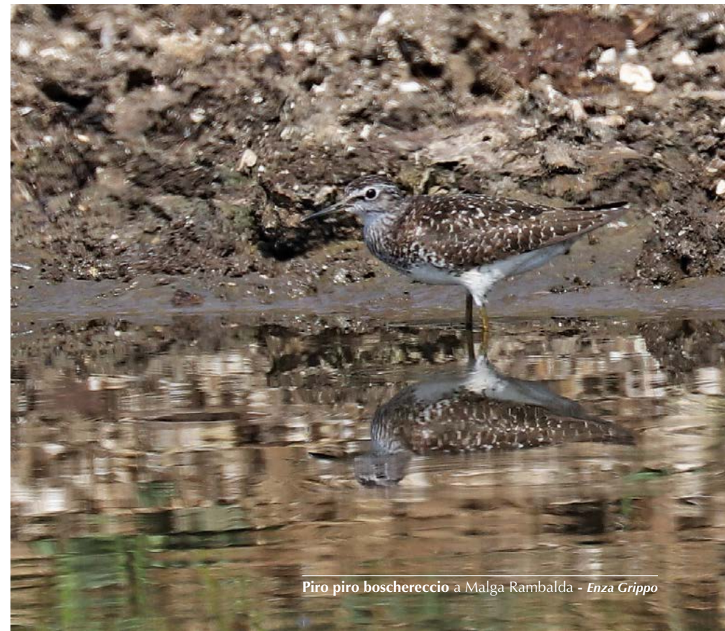
Piro piro boschereccio a Malga Rambalda