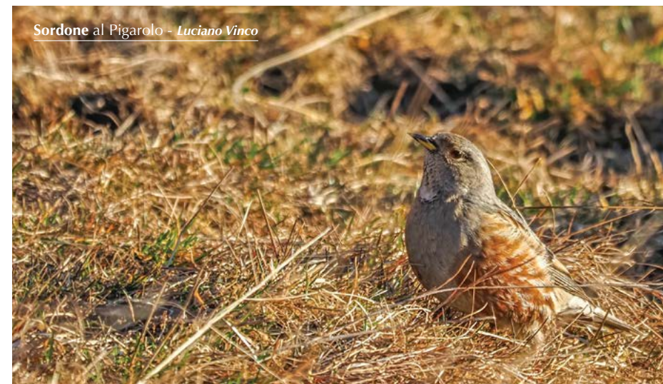
Sordone al Pigarolo - Luciano Vinco