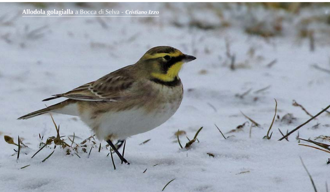
Allodola golagialla a Bocca di Selva

nel gennaio 1914, un individuo conservato al Museo Civico Ornitologico Gustavo Adolfo Carlotto di Lonato (BS).