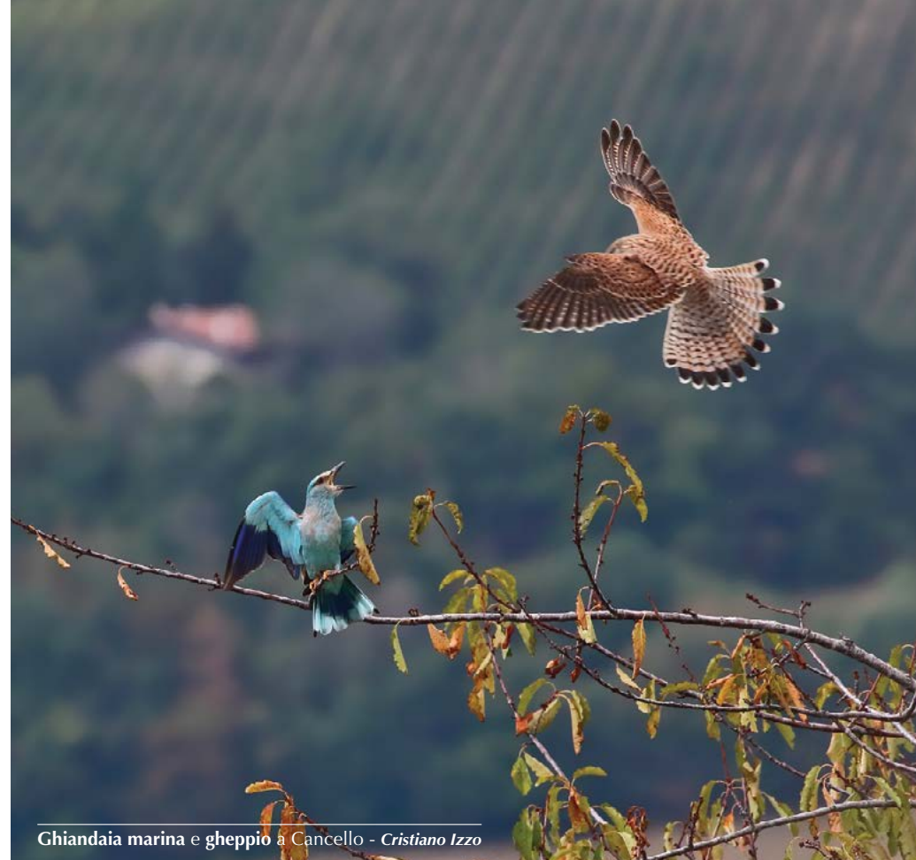
Ghiandaia marina e gheppio a Canello - Cristiano Izzo

1 ind. a Roverè Veronese il 17.04 (L. Corrier);