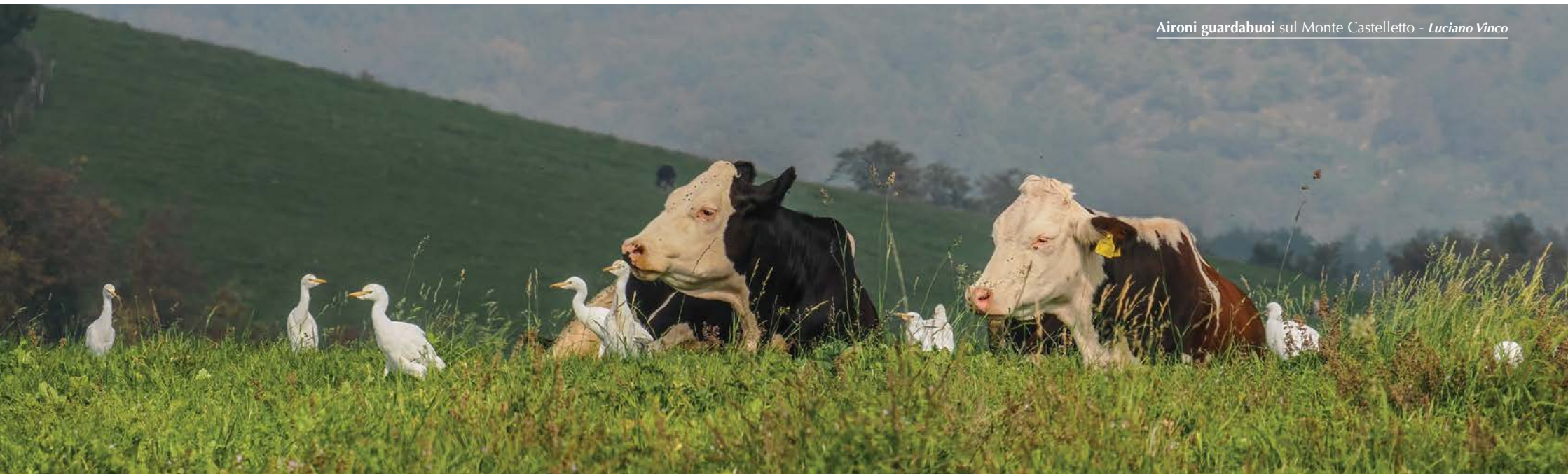
Aironi guardabuoi sul Monte Castelletto - Luciano Vinco

60-80 ind. in alimentazione sugli sfalci sul Monte Castelletto a Canello, Verona, il 4 e l'11.06 (C. Izzo, M. Allen et al.).