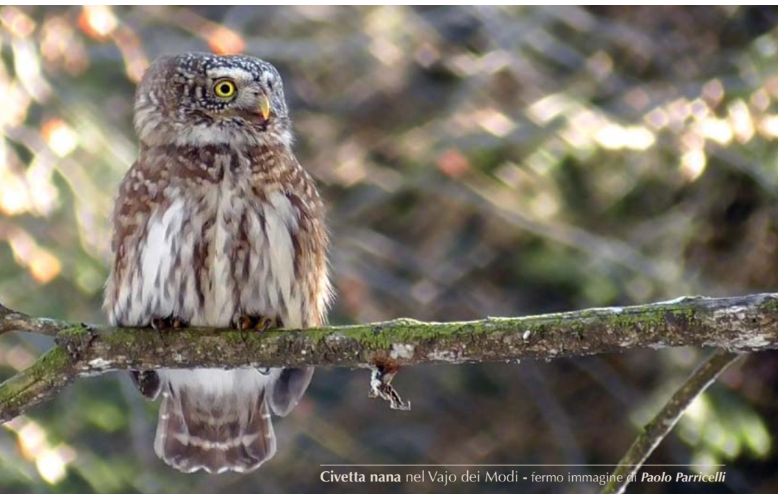
Civetta nana nel Vajo dei Modi

8-10 ind. sugli sfalci del Monte Castelletto a Cancellò, Verona, l'11.06, 3 ind. il 15.06 (M. Allen, C. Izzo, R. Fiorentini).