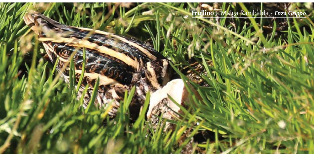
Frullino a Malga Rambalda - Enza Grippo

1 ind. lungo la strada forestale Lavachione, sul confine con Ala (TN), il 4.11 (F. Marsilli*).