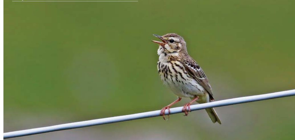
Prispolone verso il Monte Tomba - Maurizio Lezzi

Passera scopaiola Prunella modularis Motacillidae Cutrettola Motacilla flava Ballerina gialla Motacilla cinerea Ballerina bianca Motacilla alba Calandro Anthus campestris Pispola Antus pratensis Prispolone Anthus trivialis Pispola golarossa Antus cervinus Spioncello Anthus spinoletta Fringillidae Fringuello Fringilla coelebs Peppola Fringilla montifringilla Frosone Coccothraustes coccothraustes Ciuffolotto Pyrrhula pyrrhula Verdone Chloris chloris Fanello Linaria cannabina Crociere Loxia curvirostra Cardellino Carduelis carduelis Venturone alpino Carduelis citrinella Verzellino Serinus serinus Lucherino Spinus spinus Calcaridae Zigolo delle nevi Plectrophenax nivalis Emberizidae Strillozzo Emberiza calandra Zigolo giallo Emberiza citrinella Zigolo nero Emberiza cirlus Migliarino di palude Emberiza schoeniclus